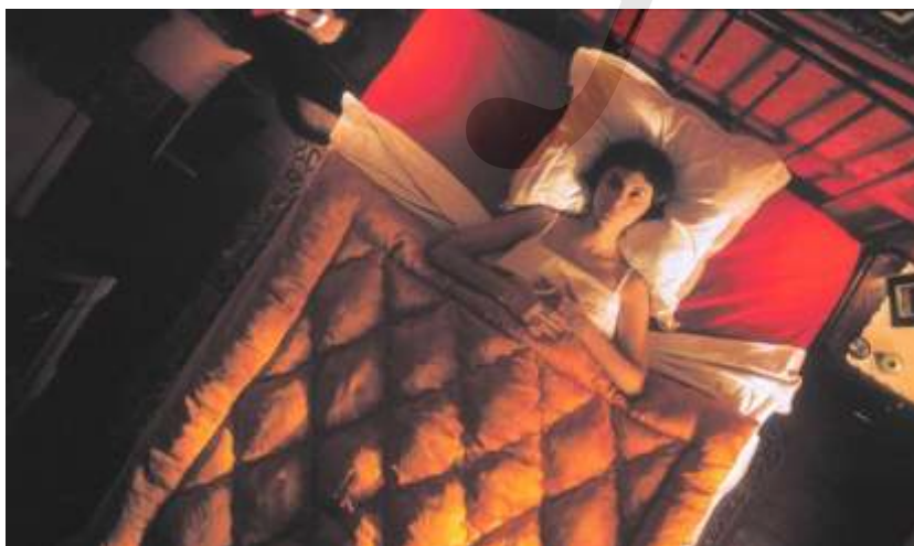
Still do filme “ O Fabuloso Destino de Amélie Poulain ” (2001)

Cada cena tem um cenário bonito e adorável, quase que adaptado de um livro de histórias infantis. Esses elementos se combinam para formar o consistente mise-en-