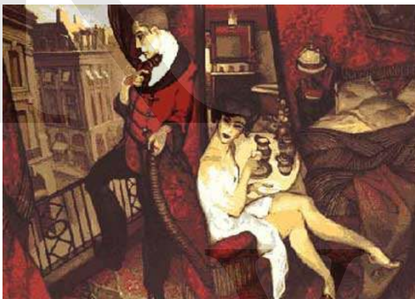
Quadro “ Chambre avec vue ” (1998) de Juarez Machado