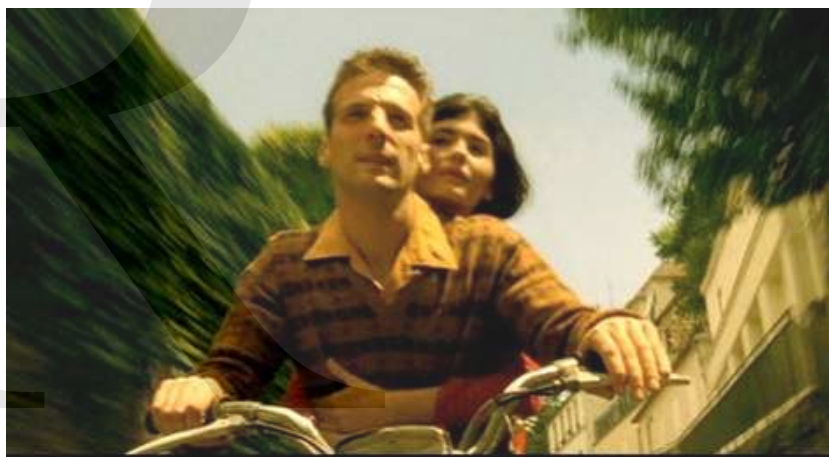
Still do filme “O Fabuloso Destino de Amélie Poulain” (2001)