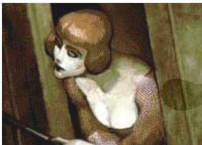
FIGURA 02 – PERSONAGEM FEMININA